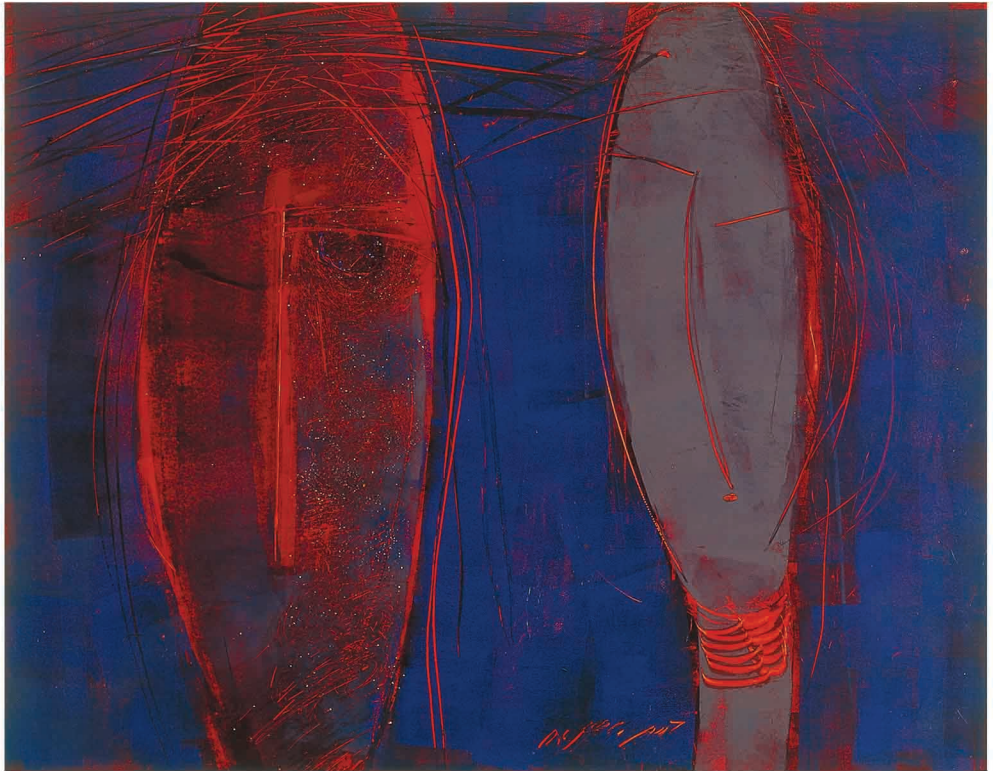
Oil on Cardboard 54 x 42 cm