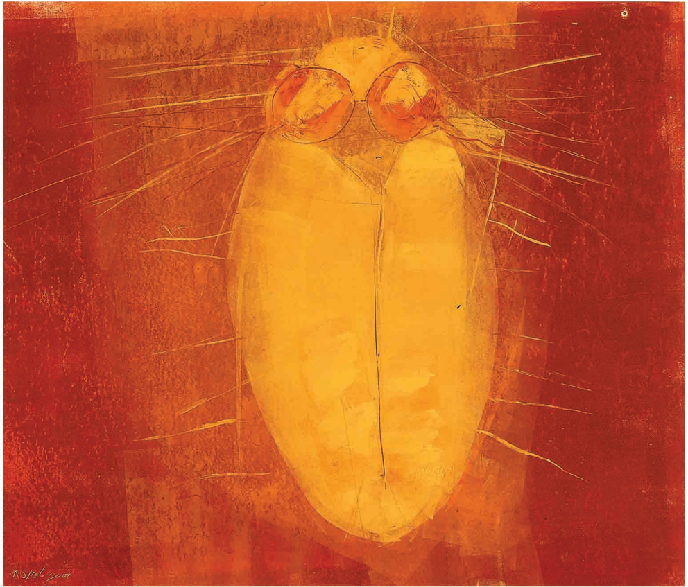
Oil on Cardboard 48 x 41 cm