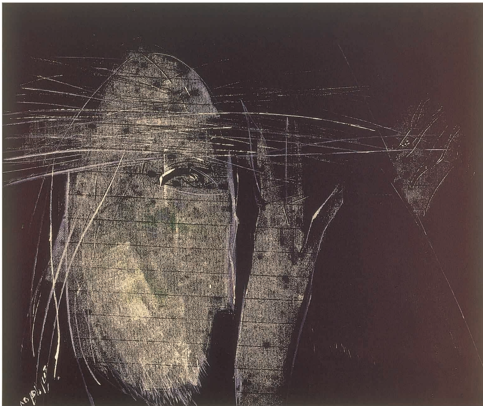
Oil on Cardboard 50 x 42 cm