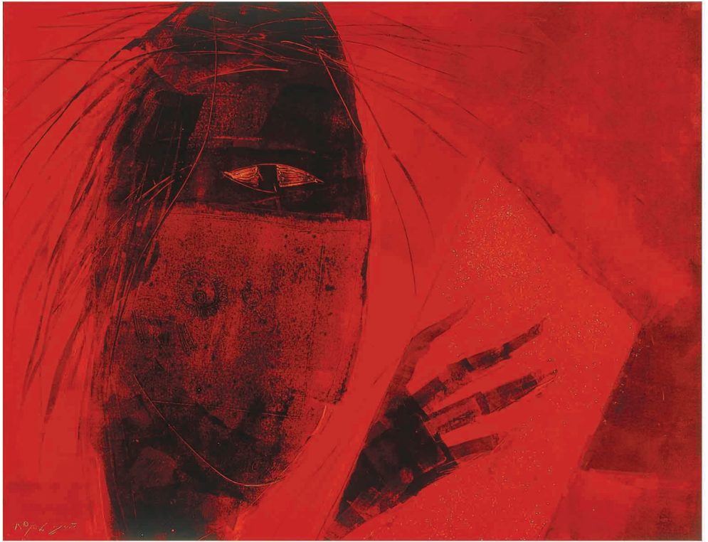
Oil on Cardboard 52 x 40 cm