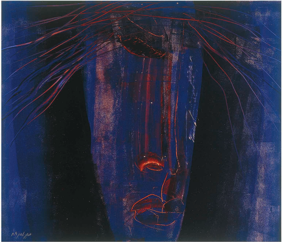
Oil on Cardboard 46 x 40 cm