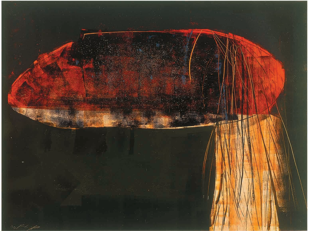
Oil on Cardboard 54 x 40 cm