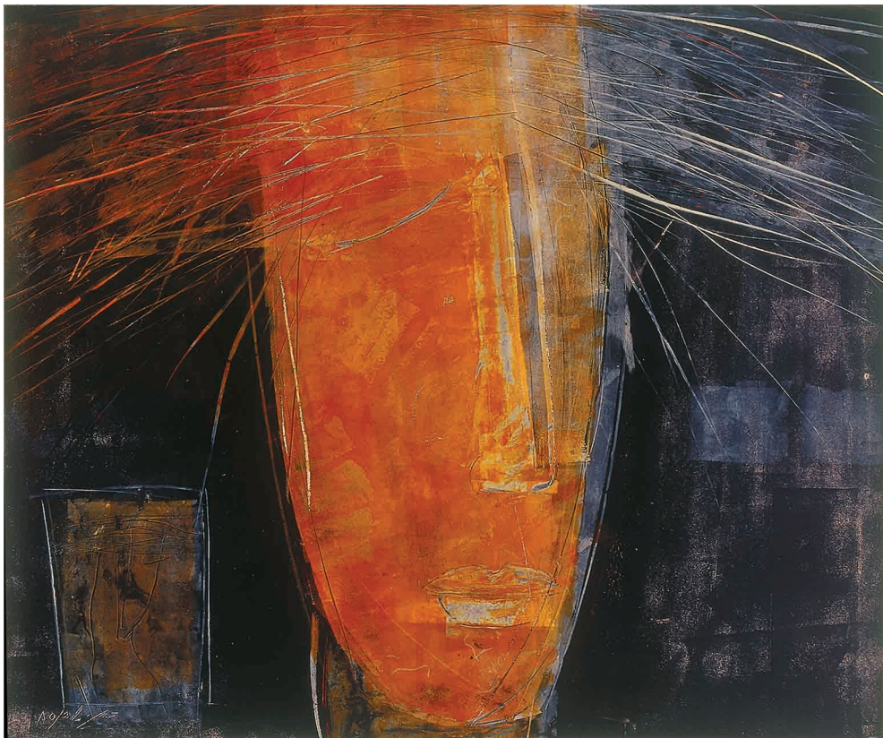
Oil on Cardboard 50 x 42 cm