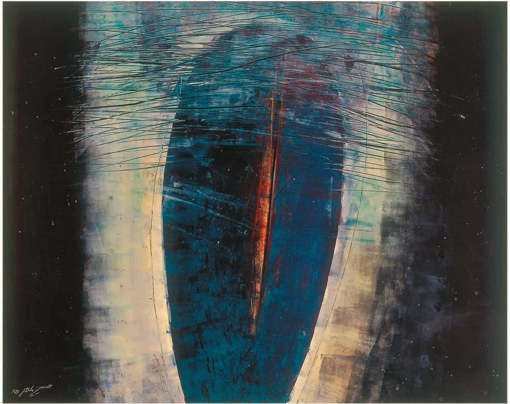
Oil on Cardboard 50 x 40 cm