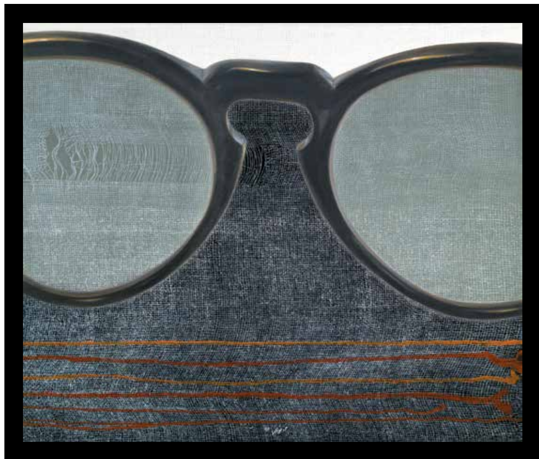
بدون عنوان، رنگ روغن روی بوم و مونوپرینت، ۵۰×۶۰ سانتی متر، ۱۳۹۲ Untitled, oil on canvas and monoprint, 50x60 cm, 2013