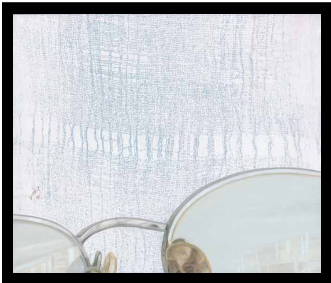
بدون عنوان، رنگ روغن روی مقوا و مونوپرینت، ۳۲/۵ × ۳۷/۵ سانتی متر، ۱۳۹۲ Untitled, oil on cardboard and monoprint, 32.5x37.5 cm, 2013