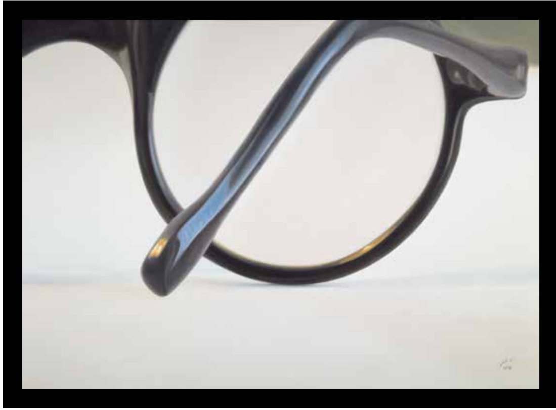
بدون عنوان، رنگ روغن روی بوم، ۵۰×۷۰ سانتی متر، ۱۳۹۲ Untitled, oil on canvas, 50x70 cm, 2014