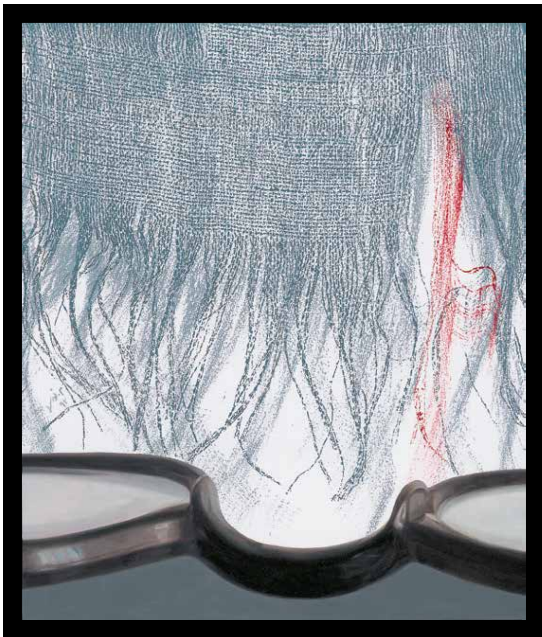
بدون عنوان، رنگ روغن روی مقوا و مونوپرینت، ۳۷/۳ × ۳۲/۵ سانتی متر، ۱۳۹۲ Untitled, oil on cardboard and monoprint, 37.3x32.5 cm, 2013