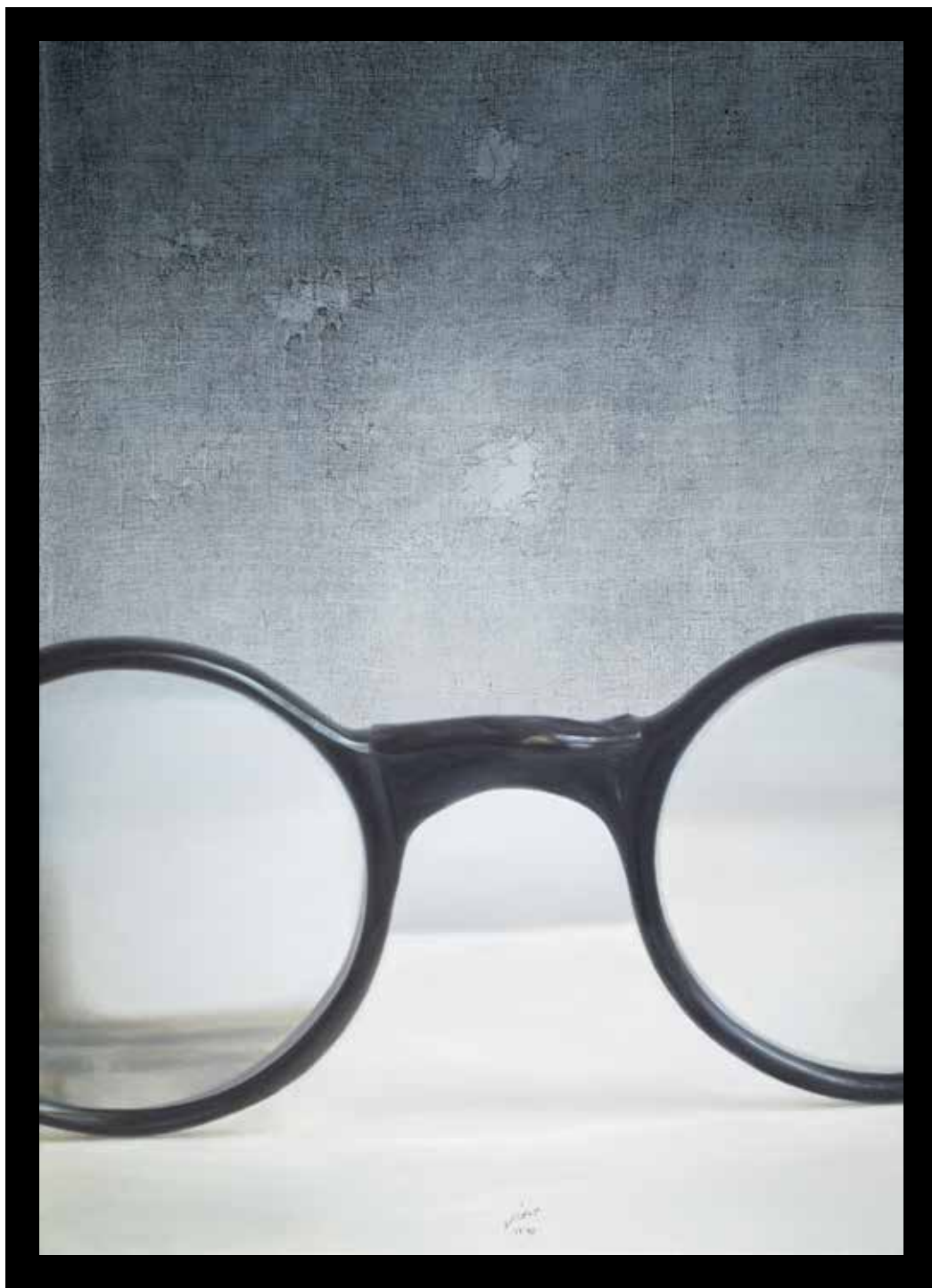
بدون عنوان، رنگ روغن روی بوم و مونوپرینت، ۷۰×۵۰ سانتی متر، ۱۳۹۲ Untitled, oil on canvas and monoprint, 70x50 cm, 2014