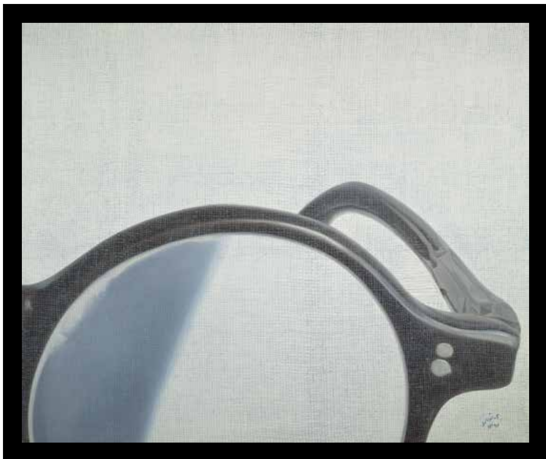
بدون عنوان، رنگ روغن روی بوم و مونوپرینت، ۵۰×۶۰ سانتی متر، ۱۳۹۲ Untitled, oil on canvas and monoprint, 50x60 cm, 2013