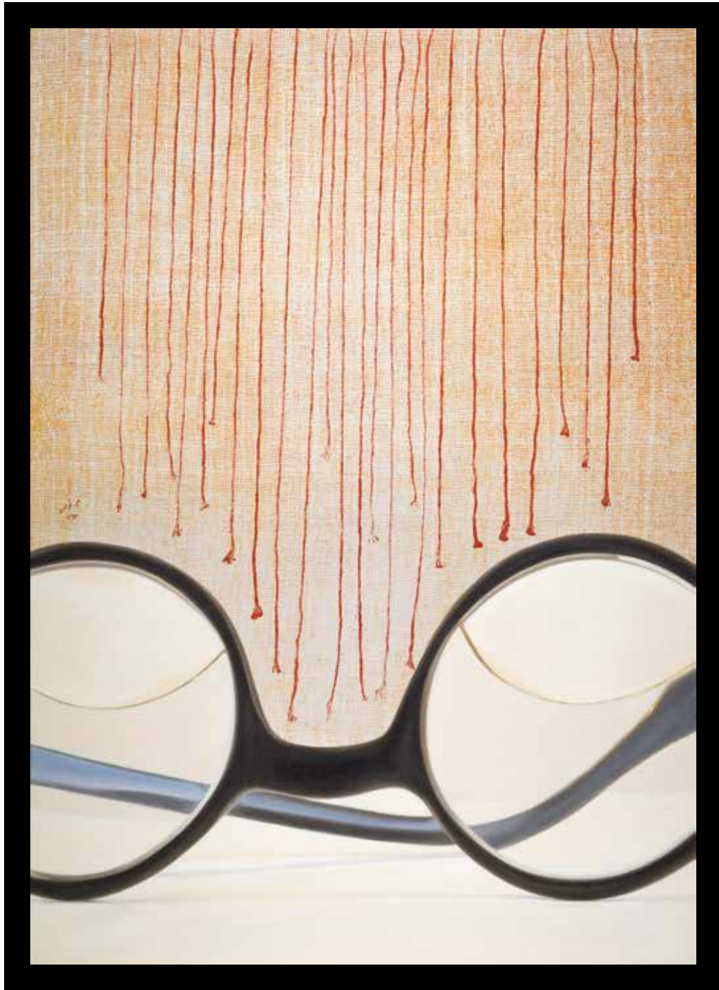
بدون عنوان، رنگ روغن روی بوم و مونوپرینت، ۷۰×۵۰ سانتی متر، ۱۳۹۲ Untitled, oil on canvas and monoprint, 70x50 cm, 2014