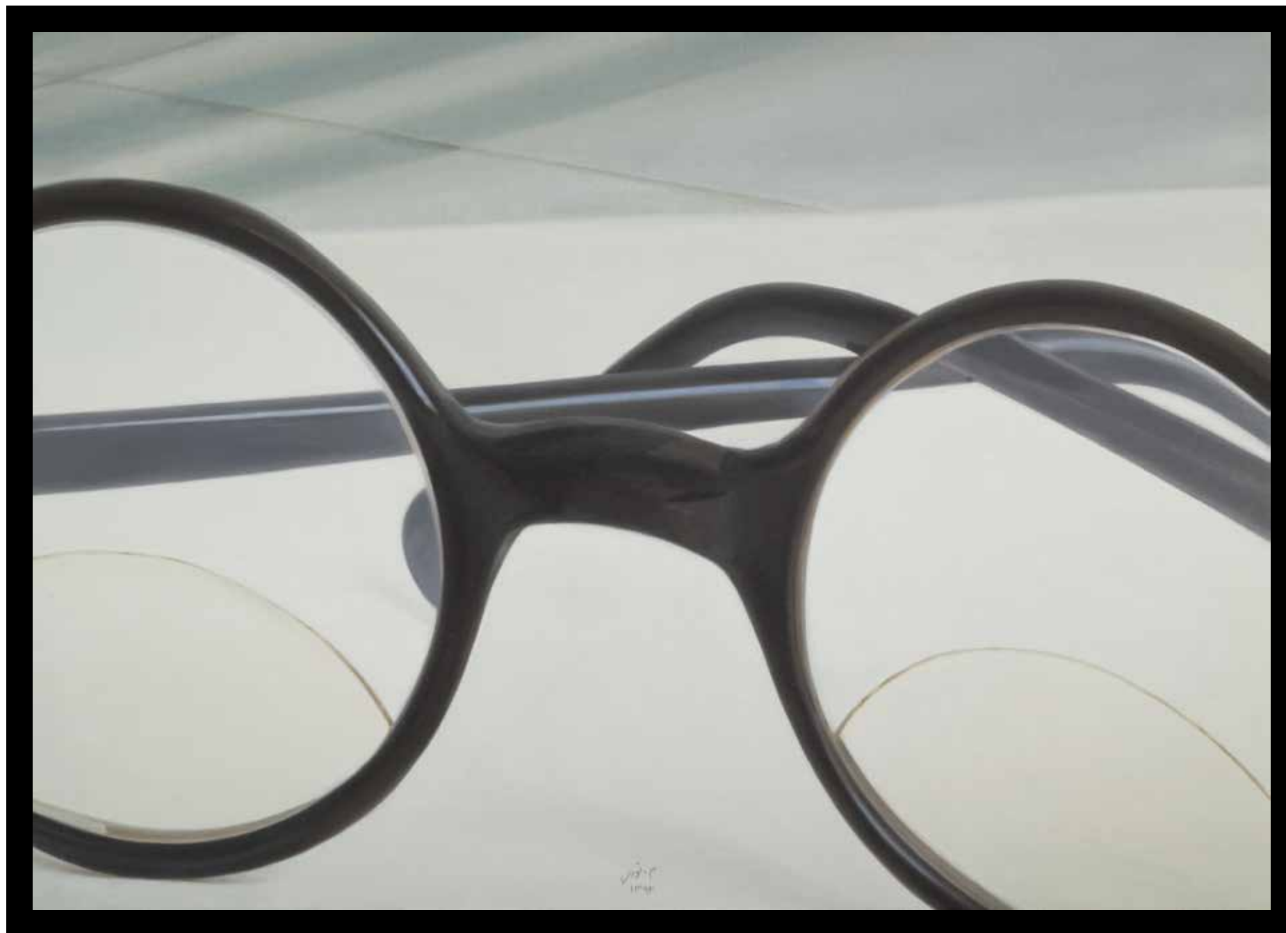
بدون عنوان، رنگ روغن روی بوم، ۵۰×۷۰ سانتی متر، ۱۳۹۲ Untitled, oil on canvas, 50x70 cm, 2014